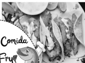
Tacos de Pescado

Venta de Comida Fish Fry Viernes, 22 de Marzo 3pm-7pm