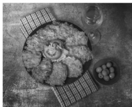
Tortas de Camaron

En el jardín de la Iglesia (Entre la Iglesia y el Convento)