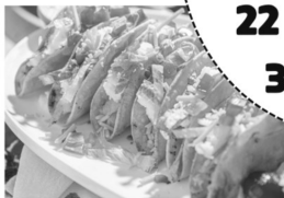
Tacos Dorados de Papa

Venta de Comida Fish Fry Viernes, 22 de Marzo 3pm-7pm